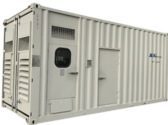
Type conteneurisé : 700-3250 kva