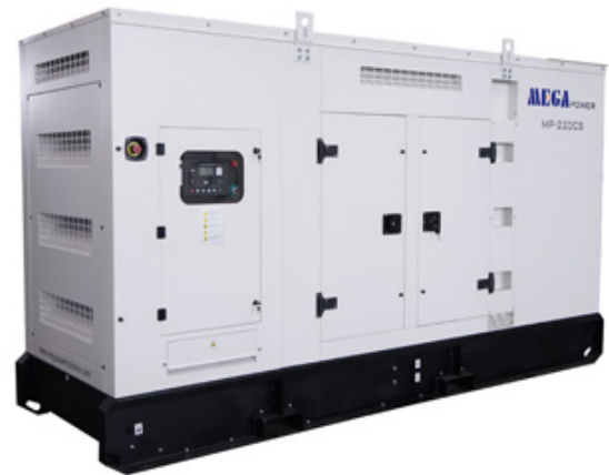
Type d'insonorisation : 10-800 kva