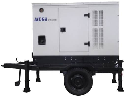
Type de remorque : 10 - 700 kva

Fourniture, Installation et maintenance.